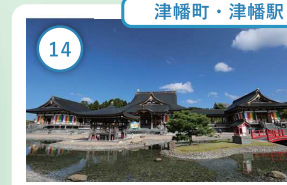
14 石川 倶利伽羅不動寺 西之坊鳳凰殿 荘厳優雅な雰囲気漂う壮大な木造 建築