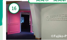
16 富山 高岡市 藤子・F・不二雄 ふるさとギャラリー 藤子・F・不二雄の「まんが」の原点に触れる