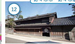
12 石川 重要文化財 喜多家住宅 酒造業を営んでいた旧家。典型的な町 家建築が見られる