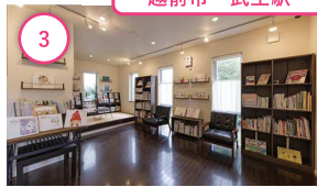
3 福井 「ちひろの生まれた家」記念館 世代を超えて愛される絵本画家 いわさきちひろの生まれた家