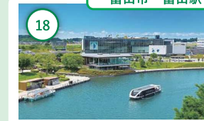
18 富山 富岩運河環水公園 立山連峰を望む屋上庭園のある美 術館や運河クルーズが楽しめる