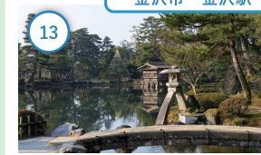
13 石川 国指定特別名勝 兼六園 日本三名園の一つに数えられる廻遊式 の庭園