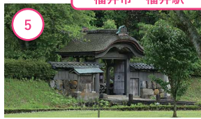
5 福井 一乗谷朝倉氏遺跡 ここに蘇る。戦国浪漫 「北の京」と呼ばれた中世の大城下町