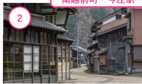
2 福井 今庄宿 江戸時代にタイムスリップしたような 気分を味わって。北国街道の宿場町