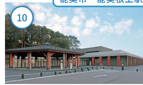
10 石川 能美ふるさとミュージアム 能美の自然・歴史・民俗について総合 的に学べる博物館