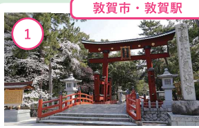
1 福井 氣比神宮 名勝「おくのほそ道の風景地」 けいの明神