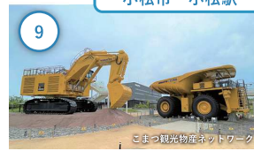
9 石川 こまつの本 建機メーカー「コマツ」創立90周年記念で 誕生。存在感抜群の超大型建機が見られる