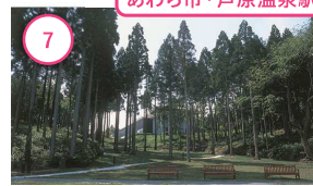
7 福井 金津創作の森 森そのものが美術館 ものづくりに癒される