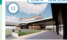
11 石川 トレインパーク白山 北陸新幹線の車両基地・新幹線技術を紹介 2024年3月13日グランドオープン