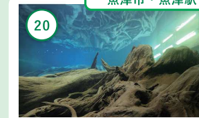
20 富山 魚津埋没林博物館 「埋没林」と「蜃気楼」富山湾の不思議が学べる