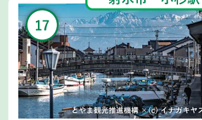
17 富山 内川周辺 映画やドラマのロケ地としても注目 のスポット