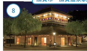
8 石川 山代温泉古総湯 明治時代の総湯を復元。当時の入浴方法 を再現し、温泉の歴史や文化を味わえる