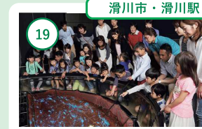
19 富山 ほたるいかミュージアム 富山湾の神秘的ほたるいかに触れる ミュージアム