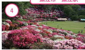
4 福井 西山公園 日本海側随一のつつじの名所 憩いの歴史公園