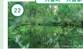
22 富山 杉沢の沢スギ 国の天然記念物に指定されている 神秘的な沢スギの林