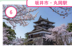
6 福井 丸岡城 北陸唯一の現存十二天守