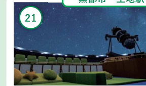
21 富山 黒部市吉田科学館 気軽に立ち寄れるプラネタリウムが魅力