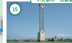
15 富山 クロスランドタワー 地上100mの展望フロアから望む 散居村やメルヘン建築